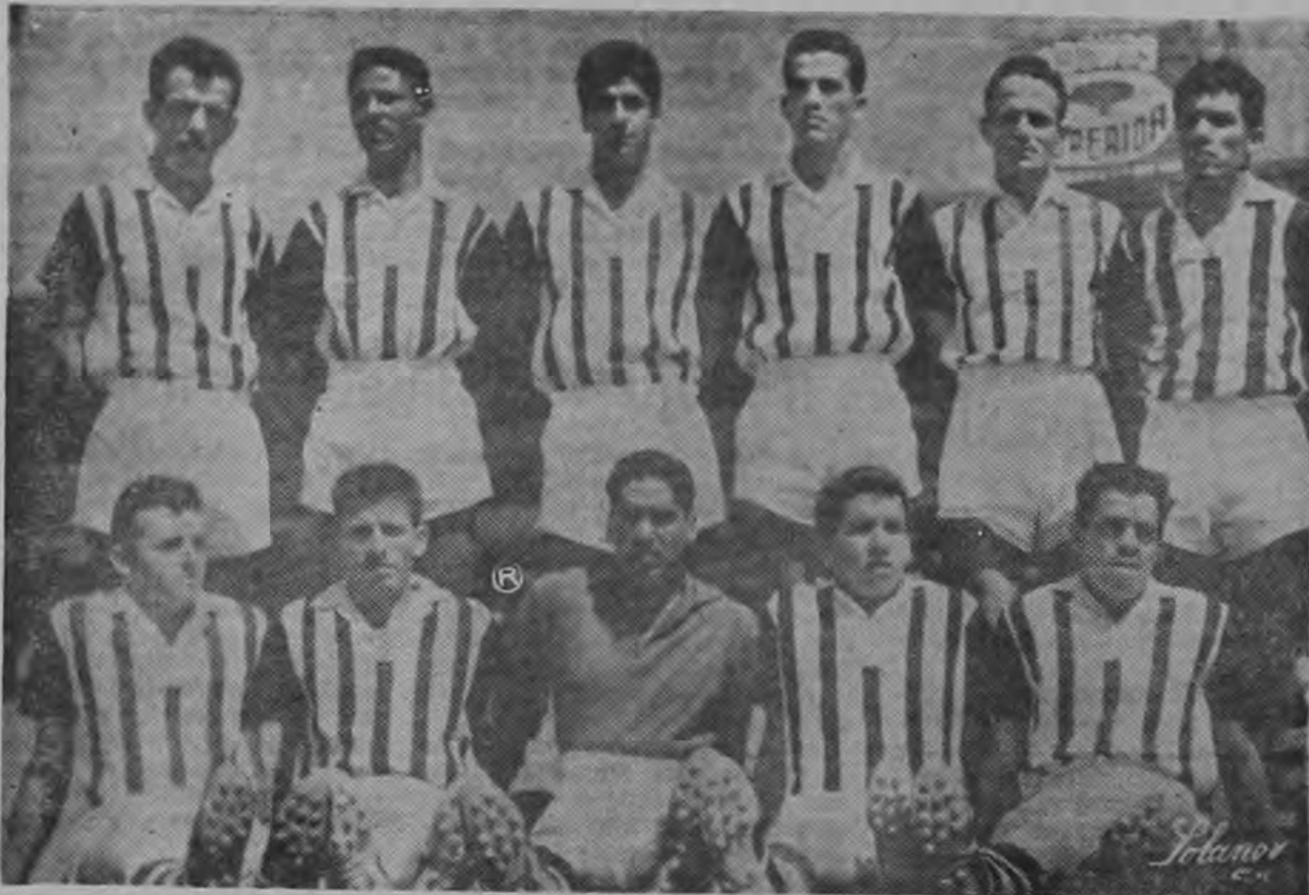
El Uruguay de Coronado con sólo empatar el domingo permanece en primeras divisiones.

Para el segundo partido de la serie de promoción anunciada para anoche se daba por un hecho la segura victoria del once isidreño.